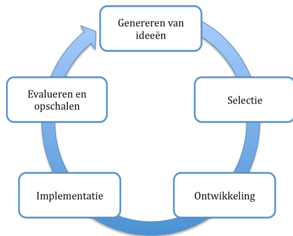
figuur 1: Het innovatieproces