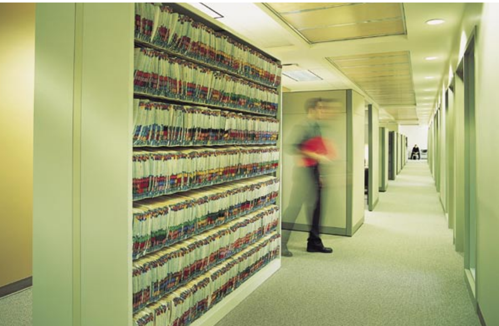
Implementatie van modellen gaat gepaard met meer papier